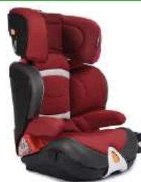
Автокресло группы III для детей массой 22-36 кг (возможно использование бустера)