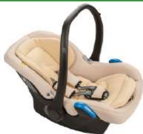
Автокресло группы 0+ для детей массой менее 13 кг