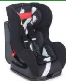
Автокресло группы I для детей массой 9-18 кг