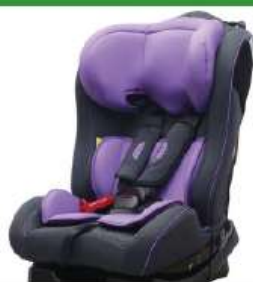
Автокресло группы II для детей массой 15-25 кг