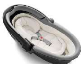
Автокресло «люлька» группы 0 для детей массой менее 10 кг

Детские удерживающие устройства подразделяют на 5 весовых групп: